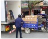
中国老龄事业发展基金会向江西省莲花县资助防疫物资1