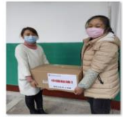
中国老龄事业发展基金会向江西省遂川县捐赠防疫物资4