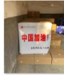
中国老龄事业发展基金会向江西省莲花县资助防疫物资3