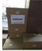
中国老龄事业发展基金会向江西省遂川县捐赠防疫物资3