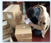
中国老龄事业发展基金会向江西省莲花县资助防疫物资2