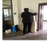
中国老龄事业发展基金会向江西省莲花县资助防疫物资4