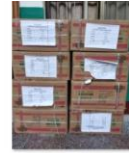
中国老龄事业发展基金会向江西省遂川县捐赠防疫物资1