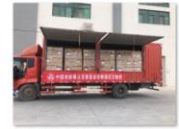
中国老龄事业发展基金会向武汉市养老机构资助防疫生活物资3