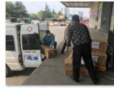
中国老龄事业发展基金会向武汉市养老机构资助防疫生活物资1