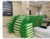
中国老龄事业发展基金会向武汉市养老机构资助防疫生活物资2